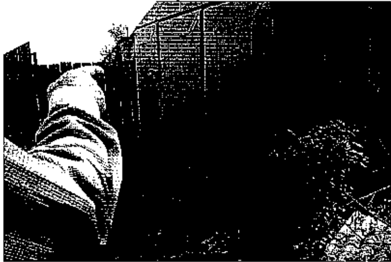
фото № 7